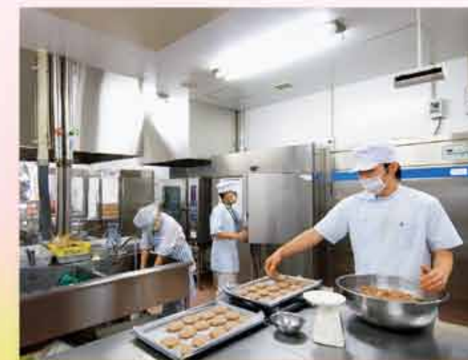
清潔な調理室で おいしいお食事を提供します