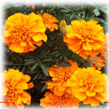
<オレンジ色のマリーゴールド> 花ことば:『真心』

4月に沼津中央病院から異動してきました。入職してから5回目の異動になりますが、毎回「どのような出会いがあるのか」 楽しみと緊張で気持ちが引き締まる感じがします。