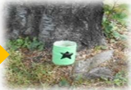
この中にピースが...