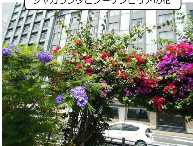
ジャカランダとブーゲンビリアの花