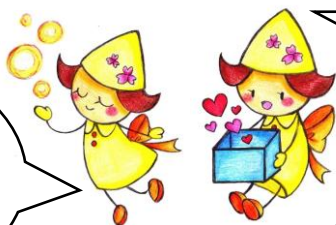
ひまちゃん♡まりちゃん

今年度も様々な『つながり』と、一緒に過ごせる時間を大切にしながら、前向きに取り組んでいきたいと思ひます。