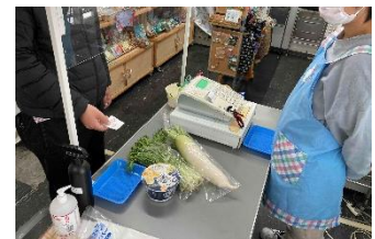
500 円分の商品と引換えです