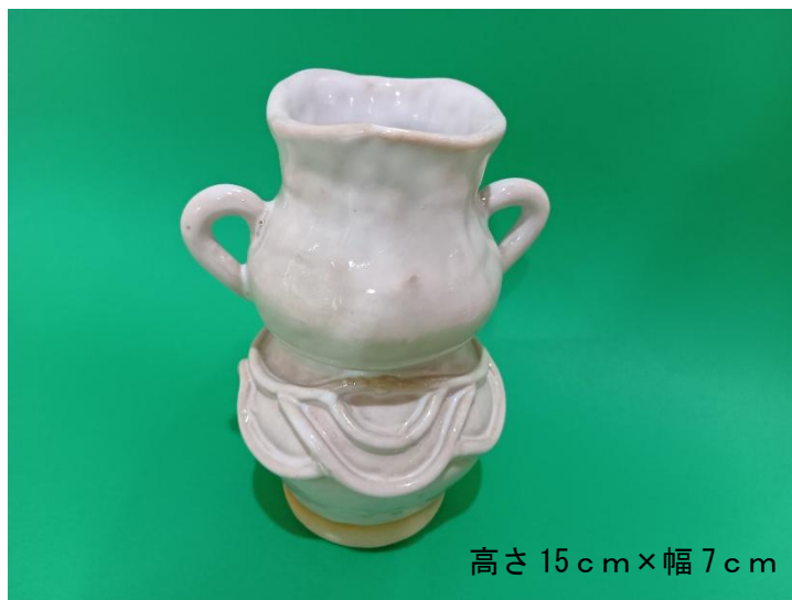
高さ 15cm × 幅 7cm