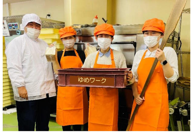
↑ 鮮やかなオレンジはゆめワークカラー。新しいエプロンで頑張るぞ！

ようやくコロナ禍も明け、世間ではイベント等で人々が集う機会も増えてきました。そのような中、「フレッシュベーカーリーゆめワーク」も5月から出張パン販売を再開しました。対面販売で直にお客様の笑顔を見られることは何よりの喜びです。今後、事業所がある田方福祉村はもちろん、市役所や関係施設にてパン販売をしますので、多くの方のご来店をお待ちしております！（武井 紗知）