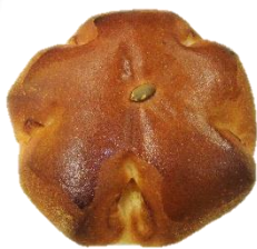
パンプキンパン 100円