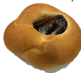
ビーフシチューパン 100円