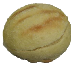
メロンパン (生クリーム入り) 120円