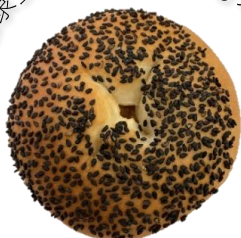
さつまいもパン 100円