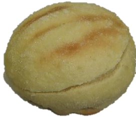
メロンパン (生クリーム入り) 120円