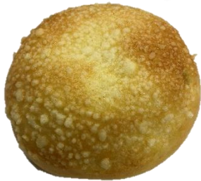
生クリームあんぱん 120円